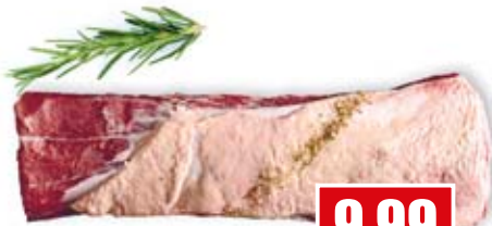
2378 ❄️ Argentinisches Roastbeef 3,5+