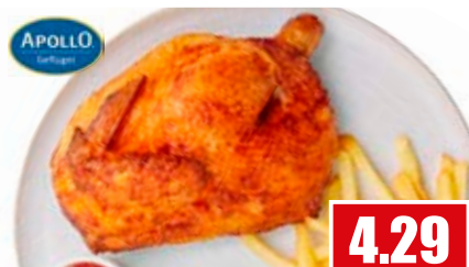
2656 ❄️ Halbe Hähnchen 450 g durchgegart 9 kg pro Karton