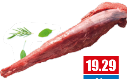
2311 ❄️ Uruguay Rinderfilet 3/4 lbs ohne Kette, einzelnd vac. im Ursprung gereift