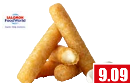
2899 ❄️ Mozzarella-Sticks im Bierteig 33-36 Stück/Beer Battered 1 kg Beutel