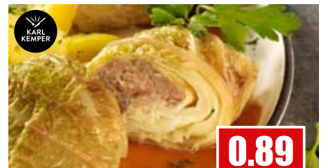
2460 ❄️ Wirsingroulade gegart, gebräunt 40x 220 g pro Karton