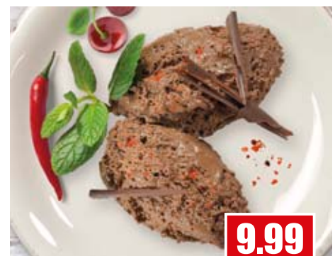
5911 Mousse au Chocolat mit Chili & Kirsche 1 kg