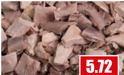
2746 ❄️ Hühnerfleisch gekocht 20 x 20 mm Schnitte 10 kg pro Karton