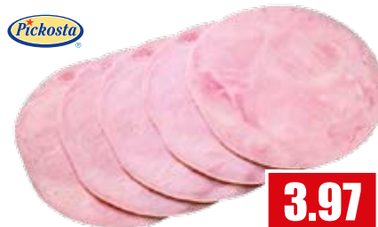
2469 Hinterkochschinken ohne Schwarte, Kaliber 140 21 Scheiben à 24 g pro Schale