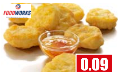
2660 ❄️ Premium Chicken-Nuggets im Backteig ca. 20 g pro Stück, paniert, gegart, vorfrittiert 12x 1 kg pro Karton