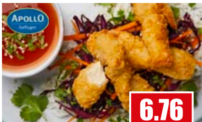
2635 ❄️ Crispy Chicken Stripes durchgegart ca. 30 g/Stück aus dem Innenfilet, Knusperpanade 2,5 kg Beutel