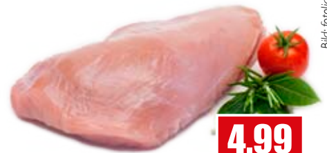
2715 ❄️ Putenbrustfilet ohne Haut und Knochen männlich, Ursprung Polen