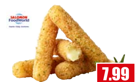
2933 ❄️ Primo Mozzarella Sticks 11 cm lange Stangen, aus echtem Mozzarella-Käse, in krosser Knusperpanade, vorgebacken 1 kg Beutel