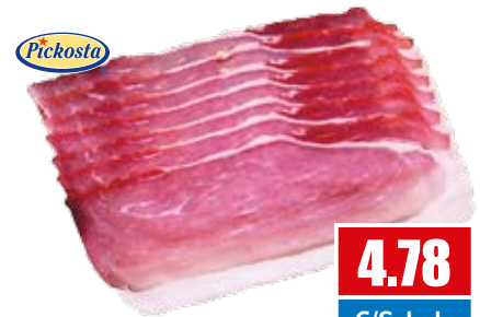
2598 Schinkenspeck geräuchert, geschnitten 500 g pro Packung