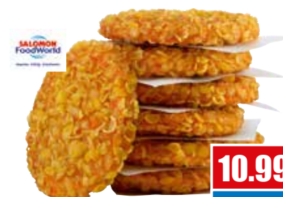
2795 ❄️ Crunchy Chikn Burger 100% Hähnchenbrustfilet in Flakes-Panade 90 g pro Stück 1,5 kg Beutel