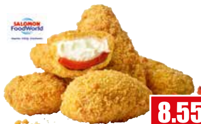
2932 ❄️ Chili Peppers „Red & Hot“ rote Jalapeno, gefüllt mit Frischkäse 1 kg Beutel