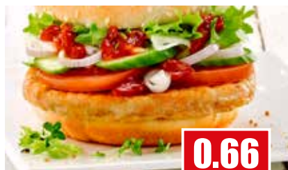
2769 ❄️ Hähnchenburger aus Keulenfleisch 120g kalibriert, roh 3 kg Karton