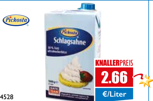
4528 H-Schlagsahne 30% 1 Liter Tetra