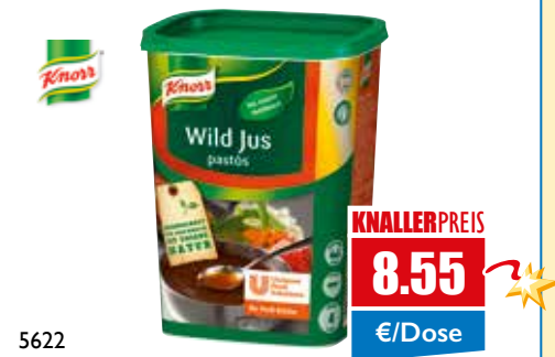
5622 Jus zu Wild, pastös 450 g Dose