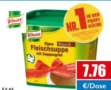
5646 Klare Fleischsuppe mit Suppengrün ergibt 40 Liter 880 g Dose