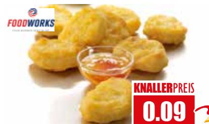
2660 ❄️ Premium Chicken-Nuggets im Backteig ca. 20g pro Stück paniert, gegart, vorfrittiert 12x 1 kg pro Karton