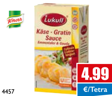
4457 Käse-Gratin-Sauce Emmentaler 1 Liter Tetra