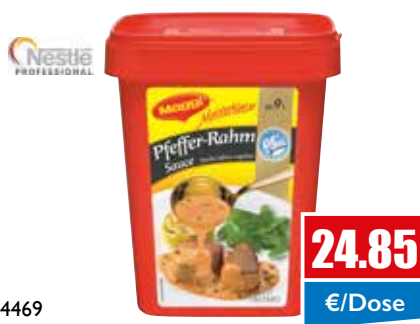
4469 Pfeffer Rahm-Sauce ergibt 9 Liter 1 kg Prof-Box