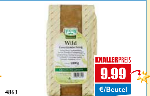
4863 Wildgewürz gemahlen 1 kg Beutel