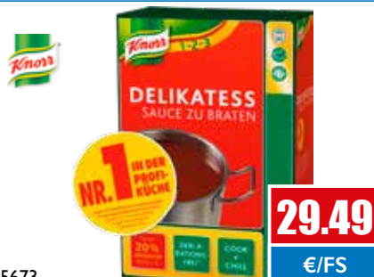
5673 Delikatess Sauce zu Braten Instant, o.d.Z. ergibt ca. 30 Liter 3 kg pro Faltschachtel