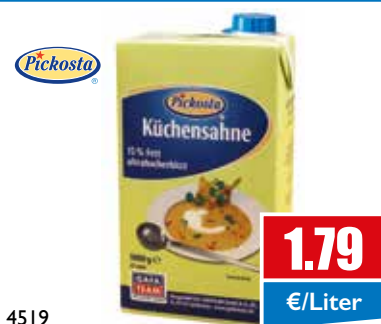
4519 H-Küchensahne 15% 1 Liter TetraPickosta€ 1,79/Liter