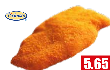
2702 ❄️ Putenschnitzel ca. 160g

paniert, ungegart 8% Flüssigwürzung 3 kg pro Karton