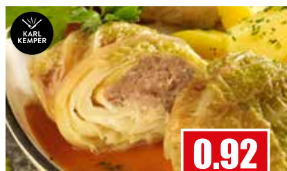
2460 ❄️ Wirsingroulade gegart, gebräunt 40x 220g pro Karton