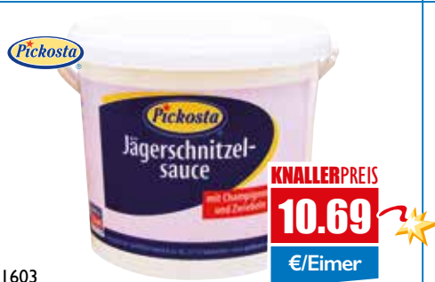
1603 Jäger-Schnitzel-Sauce 5 kg Eimer