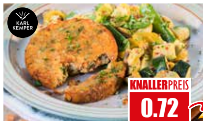
1270 ❄️ Süßkartoffel-Amaranth-Burger vorfrittiert 40x 125g pro Karton