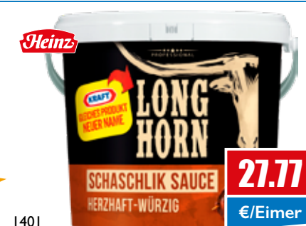
1401 Schaschlik Sauce 12 kg Eimer