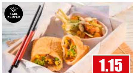
1267 ❄️ Frühlingsrolle „Deluxe“ vorfrittiert 30x 200g pro Karton