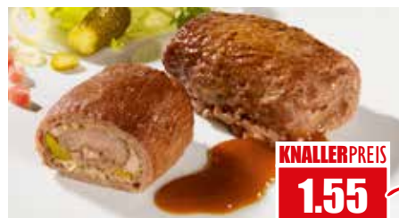
3304 ❄️ Rinder-Roulade „Hausfrauenart“ ungegart 36x 220g pro Karton