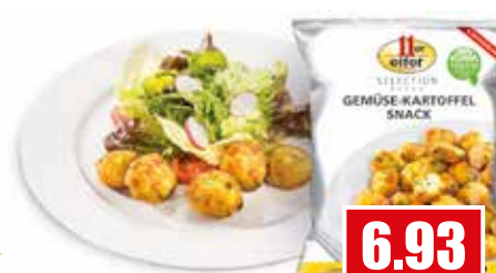
1255 ❄️ Iler Gemüse Kartoffel Snack ca. 23 g pro Stück 1 kg Beutel