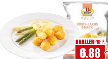
1077 ❄️ Rösti-Lachs-Snack mit Räucherlachs und Frischkäse ca. 22g pro Stück vorgebacken in Sonnenblumenöl 1 kg Beutel