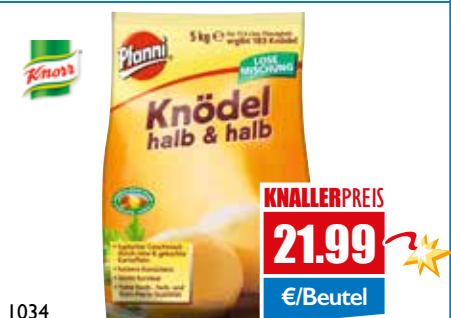
1034 Knödel halb & halb 5 kg Beutel