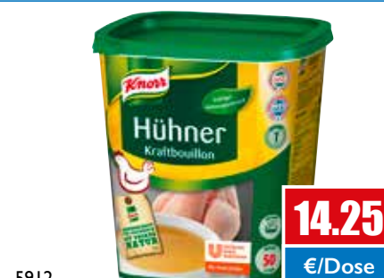
5912 Hühner Kraftbouillon ohne Suppengrün ergibt 50 Liter 1 kg Dose