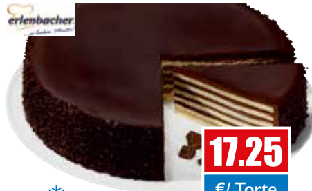
3239 ❄️ Herrentorte ungeschnitten, Ø 28 cm 2.200 g pro Torte