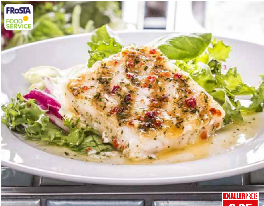
4344 ❄️ MSC Mini Grill-Fischportionen Mediterran Alaska-Seelachsfilet, praktisch grätenfrei 85 x ca. 70 g pro Karton