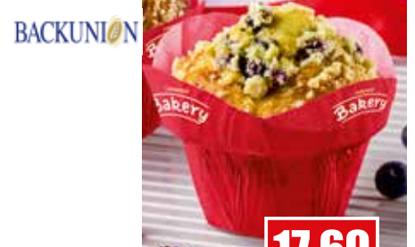
80241 ❄️ Blaubeer-Muffins ca. 35 x 75 g pro Karton