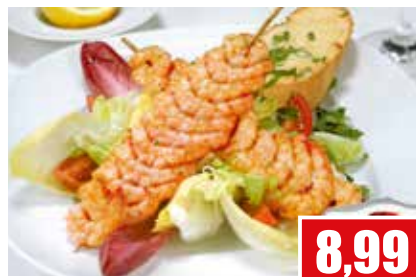
4353 ❄️ Garnelen-Spieß ca. 10 - 12 Garnelen pro Spieß 10 x 100 g pro Packung