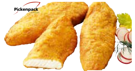
6652 ❄️ Seelachs in Backteig 80 x 75 g pro Karton