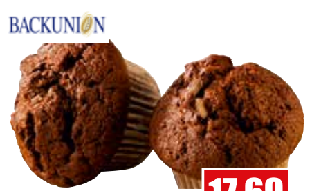
80233 ❄️ Schoko-Muffins ca. 35 x 75 g pro Karton