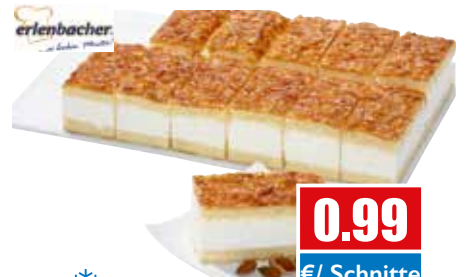
3255 ❄️ Mandel-Bienenstich-Schnitte in 12 Portionen vorgeschnitten 104 g pro Schnitte