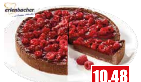
3562 ❄️ Chocolate-Raspberry-Cake vorgeschnitten in 12 Portionen Ø 24 cm, 1.200 g pro Kuchen ca. 100 g pro Portion