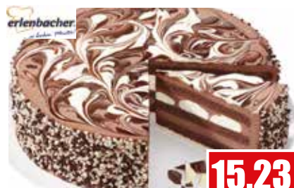
3265 ❄️ Schoko-Sahne Duo ungeschnitten, Ø 28 cm 2.050 g pro Torte