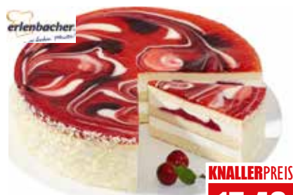
5465 ❄️ Kirsch-Käse-Sahne-Traum ungeschnitten, Ø 28 cm 2,5 kg pro Torte