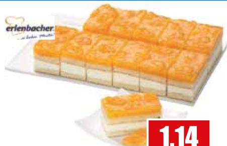
3272 ❄️ Mandarinen-Käse-Sahne-Schnitte in 12 Portionen vorgeschnitten 125 g pro Schnitte