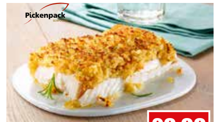
4347 ❄️ Schlemmerfilet "Bordelaise" praktisch grätenfrei, 34 x 180 g pro Karton