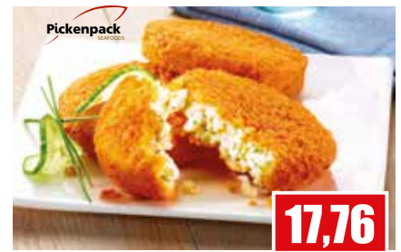
4322 ❄️ Fisch-Burger paniert 80 x 75 g pro Karton