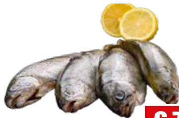
4384 ❄️ Regenbogenforelle 180 - 220 g, praktisch grätenfrei 5 kg pro Karton