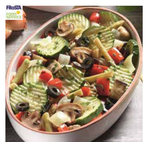
6081 ❄️ Grill-Pfannengemüse "Mediterran" Gemüsemischung mit gegrillter Zucchini, Paprika und Zuckererbsenschoten in einer mediterranen Sauce 1,5 kg Beutel