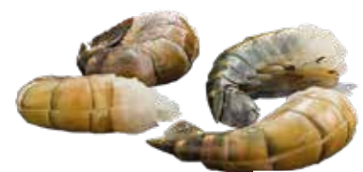
4375 ❄️ Party Garnelen 26/30 mit Schwanzsegment 1 kg pro Beutel