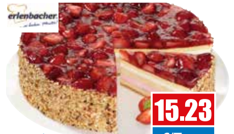
3250 ❄️ Erdbeer-Buttermilch-Torte ungeschnitten, Ø 28 cm 2.250 g pro Torte