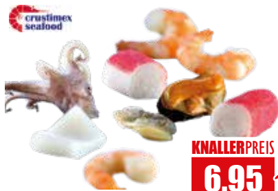
6626 ❄️ Frutti di Mare special Meeresfrüchte mit Surimi 1 kg Beutel