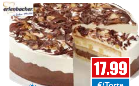
3238 ❄️ Birne-Helene-Torte ungeschnitten, Ø 28 cm 2.450 g pro Torte