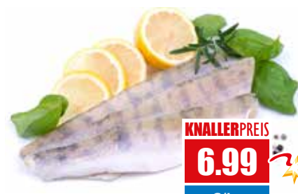
4372 ❄️ Zanderfilet mit Haut 170 - 230 g, entschuppt, praktisch grätenfrei, 20 % Glasur, 5 kg Karton