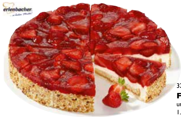
3251 ❄️ Fruchtkuchen Erdbeer ungeschnitten, Ø 26 cm 1.750 g pro Kuchen